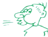
Tregui tot l'aire dels pulmons