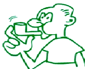
Comenci agafant aire i pressioni l'inhalador una vegada