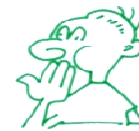
Aguanti la respiració durant 10 segons