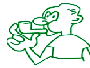
Posi's l'inhalador a la boca