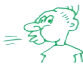
Tregui l'aire lentament