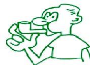
Continui agafant aire