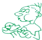
Tregui el tap de l'inhalador