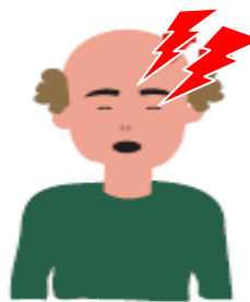
Mal de cap fort inhabitual, d'inici sobtat