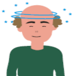
Mareig sense motiu aparent