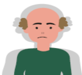
Visió borrosa, alteracions en la visió