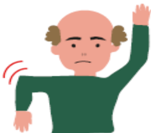
Pèrdua de força en un braç