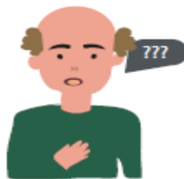
Confusió, problemes de parla, problemes de comprensió