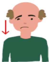
Caiguda de la cara, alteració de la sensibilitat.

A la següent imatge es resumeixen els signes i símptomes que poden indicar que s'està produint un l'ictus. En cas que es presentin aquests símptomes, és important acudir URGENTMENT a l'hospital per valorar la possibilitat d'estar patint un l'ictus i rebre tractament.