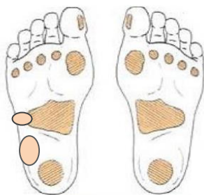
Zonas de riesgo